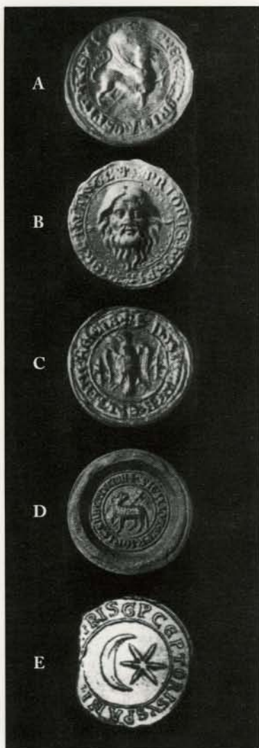
A : sceau du grand commandeur de l'Hôpital