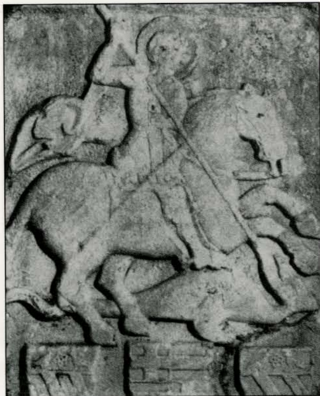
Bas-relief d'un saint guerrier, probablement saint Georges, surmontant le blason des frères hospitaliers et peut-être du donateur. (Château de Bodrum, Turquie)

En tant que personnage principal sur le plan militaire, le maréchal est abondamment consulté pour son expertise dans les affaires orientales. Mais son pouvoir est limité par les changements continuels de postes. L'équipement militaire fourni par l'ordre est centralisé dans ses locaux à moins qu'il ne soit spécifiquement destiné au Krac des chevaliers ou à Margat. Le maréchal peut de surcroît réquisitionner ce matériel chez ses chefs locaux. Le maréchalat gère deux départements : l'arsenal, où un frère sergent veille sur tout l'équipement militaire, à l'exception des arbalètes, et les étables qui font face à un manque chronique de remonte, qui n'a jamais été comblé par les chevaux en provenance d'Europe.