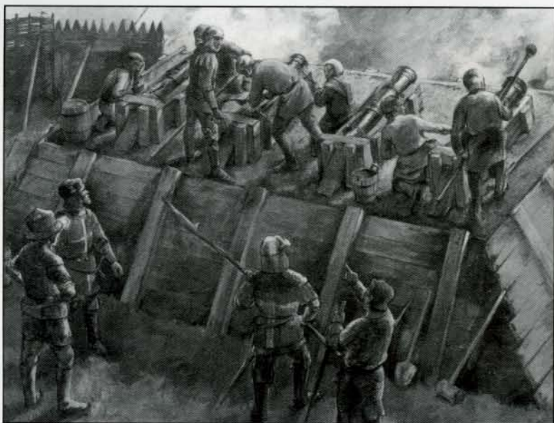
Les hospitaliers défendent Rhodes contre la flotte mamelouke en 1444.

Certaines illustrations nous montrent des décorations magnifiques tant dans l'habillement que les armes et le harnachement des chevaux. Mais le décret publié en 1558 par le grand maître de La Valette promettant quatre années de galères aux hospitaliers portant des pantalons brodés, ne prouve pas forcément que les frères faisaient preuve d'extravagance.