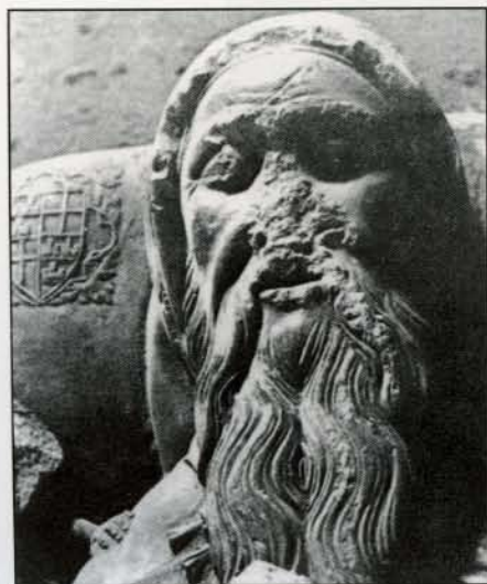
Gisant de Juan Fernández de Heredia, grand maître des hospitaliers, portant son blason écartelé aux armes de l'ordre. (Casse, détruit durant la guerre civile espagnole)

Jacques-de-Compostelle et tiennent des hospices sans réelle présence militaire.