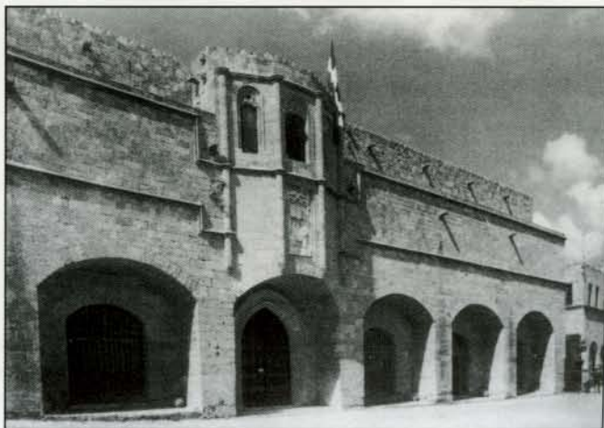
L'hôpital ou infirmerie de Rhodes du xv e siècle et ses magasins au rez-de-chaussée, loués pour fournir des revenus.