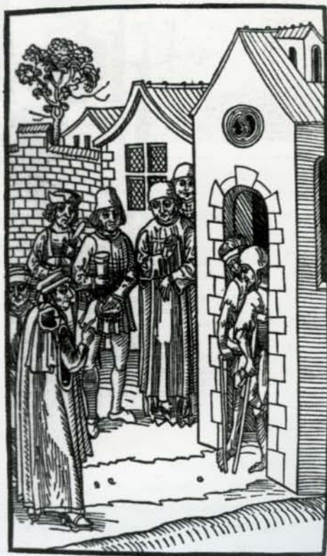
Gravure sur bois représentant des frères hospitaliers, des domestiques et des médecins visitant les malades en 1493.

Les hospitaliers ont rapidement adopté les armes à feu, ainsi le prieur de Catalogne disposait d'une bombarde dès 1395. En 1531, l'ordre de Malte tente d'acquérir des canons par tous les moyens, et, cette année-là, une cargaison arrive d'Angleterre, un cadeau du roi Henri VIII. Les pièces comprenaient aussi bien des bombardes que des pièces plus petites, dont un pavois doté d'un canon en son centre, qui se trouve toujours sur l'île.